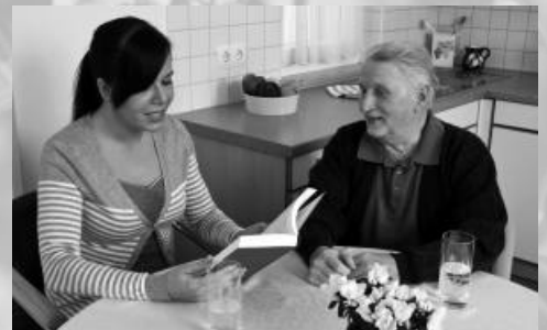
Beliebt im Altenheim im Winter: Lesen und Vorlesen-Lassen