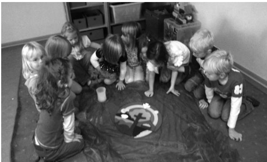
Kinder aus dem „Löwenzahn“-Kindergarten legen den Schöpfungskreis.