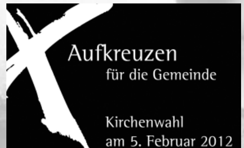
„Aufkreuzen für die Gemeinde“: Neues Presbyterium 2012