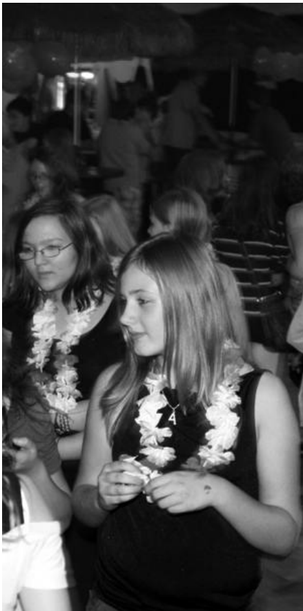
Disco: Party geht auch ohne Alkohol!

Lange hat es gedauert: nach über 10 Jahren gab es wieder eine Disco im Gemeindehaus Rahden. Neu daran: nicht mehr im Jugendkeller, sondern im großem Saal! Und der war dann auch rappellvoll: 156 begeisterte Discogäste konnten am ersten Abend gezählt werden. Und die waren vom Ambiente im Gemeindehaus ange- tan. Die Mitarbeiter hatten neben drei Strandkörben, Palmen und Sonnenschirmen ein Feuerwerk an Technik für Sound und Light aufgebaut. Und an der Südseebar gab es verschiedene Cocktails.