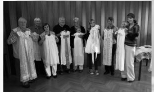
„Jahr der Taufe“: Taufkleider-Ausstellung in Rahden