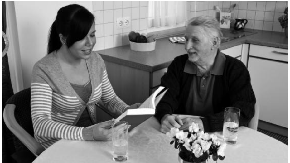
Eine Welt zwischen zwei Buchdeckeln: Vorlesen und Zuhören.