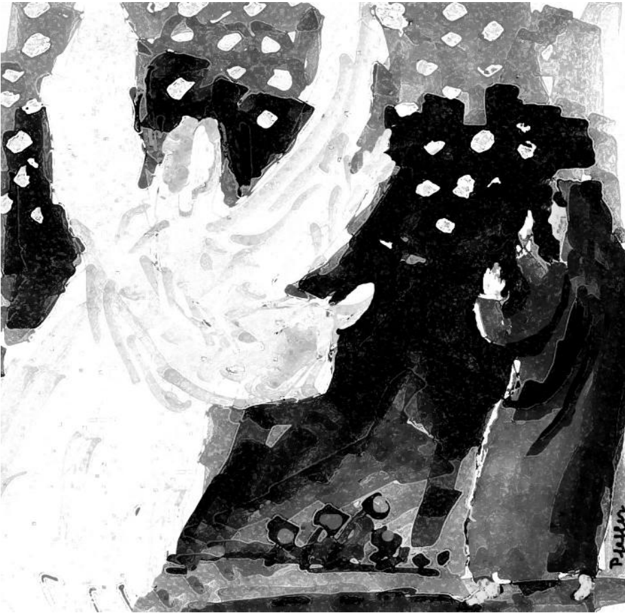
Der Engel verkündet Maria, dass sie ein Kind bekommen wird: Jesus.