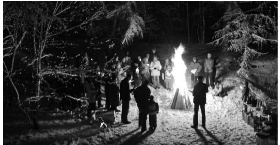
Treffen vor Weihnachten: die Waldweihnacht in Wehe.