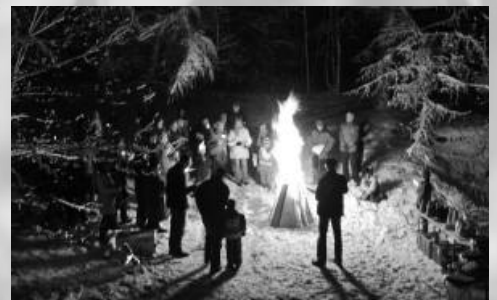
Vorweihnachtszeit in Rahden: Waldweihnacht in Wehe