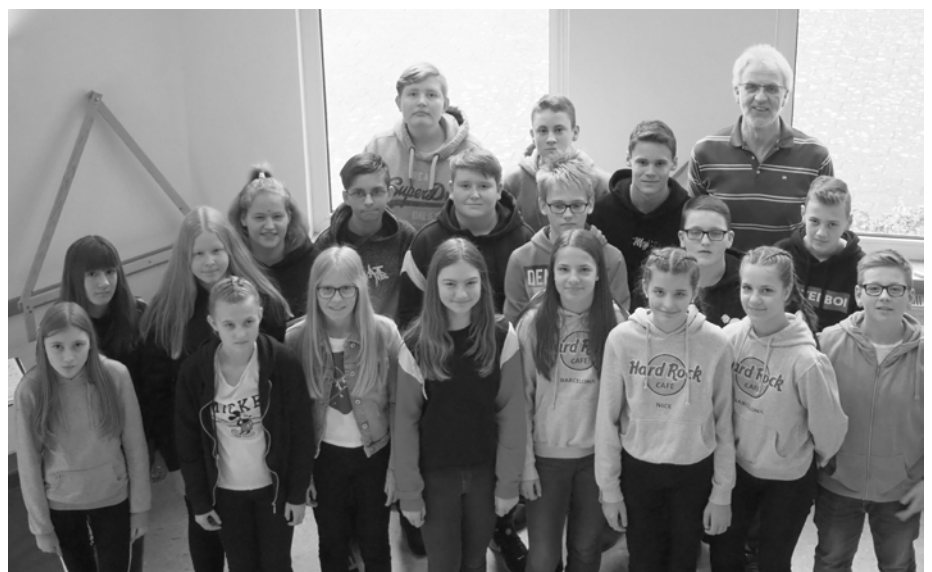
Werden am 12. Mai in der St. Johannis-Kirche konfirmiert: Jugendliche aus dem Bezirk Mitte.