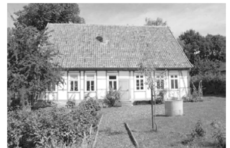
Die alte Schule in Hiddenhausen.

Der Mai-Ausflug der Frauenkreise des Westbezirks geht am 15. Mai nach Hiddenhausen. Eine Führung durch die alten Gebäude und den Bauerngarten der Museumsschule, verbunden mit einer historischen Schulstunde, steht auf dem Programm. Anschließend wird im Hofcafé Düsediekerbäumer Kaffee getrunken. Der Reisepreis von 21 Euro pro Person beinhaltet alle Kosten und wird im Bus eingesammelt. Um 12 startet der Bus in Sielhorst, um 12.10 Uhr in Varl, um 12.20 Uhr in Varlheide und um 12.30 Uhr am Paul-Gerhardt-Haus. Nach dem gemeinsamen Abschluss in der Ev. Kirche in Oetinghausen werden die Frauen zwischen 18.30 und 19.00 Uhr wieder in Rahden sein. Anmeldungen sind ab sofort im Gemeindebüro möglich. (GK)