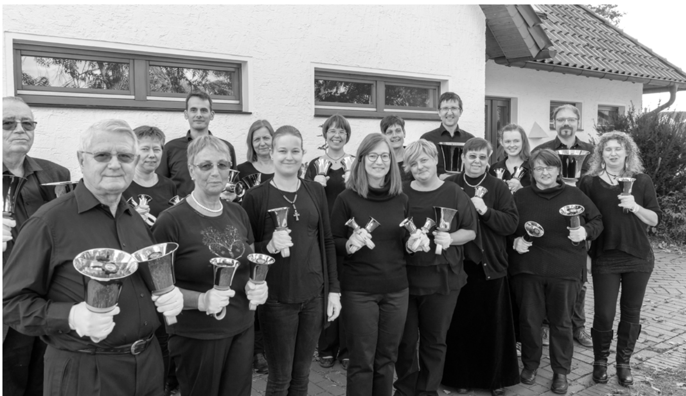
Der Handglockenchor würde sich über Verstärkung freuen. Am 5. Mai gibt's einen „Schnuppertag“ im Gemeindehaus.

Du magst Musik und hast Gefühl für Rhythmus? Du hast Lust, etwas Neues auszuprobieren? Dann hilf uns, unsere Glocken und Chimes zum Klingen zu bringen. Wir sind 28 Hände für 60 Glocken und 36 Chimes.