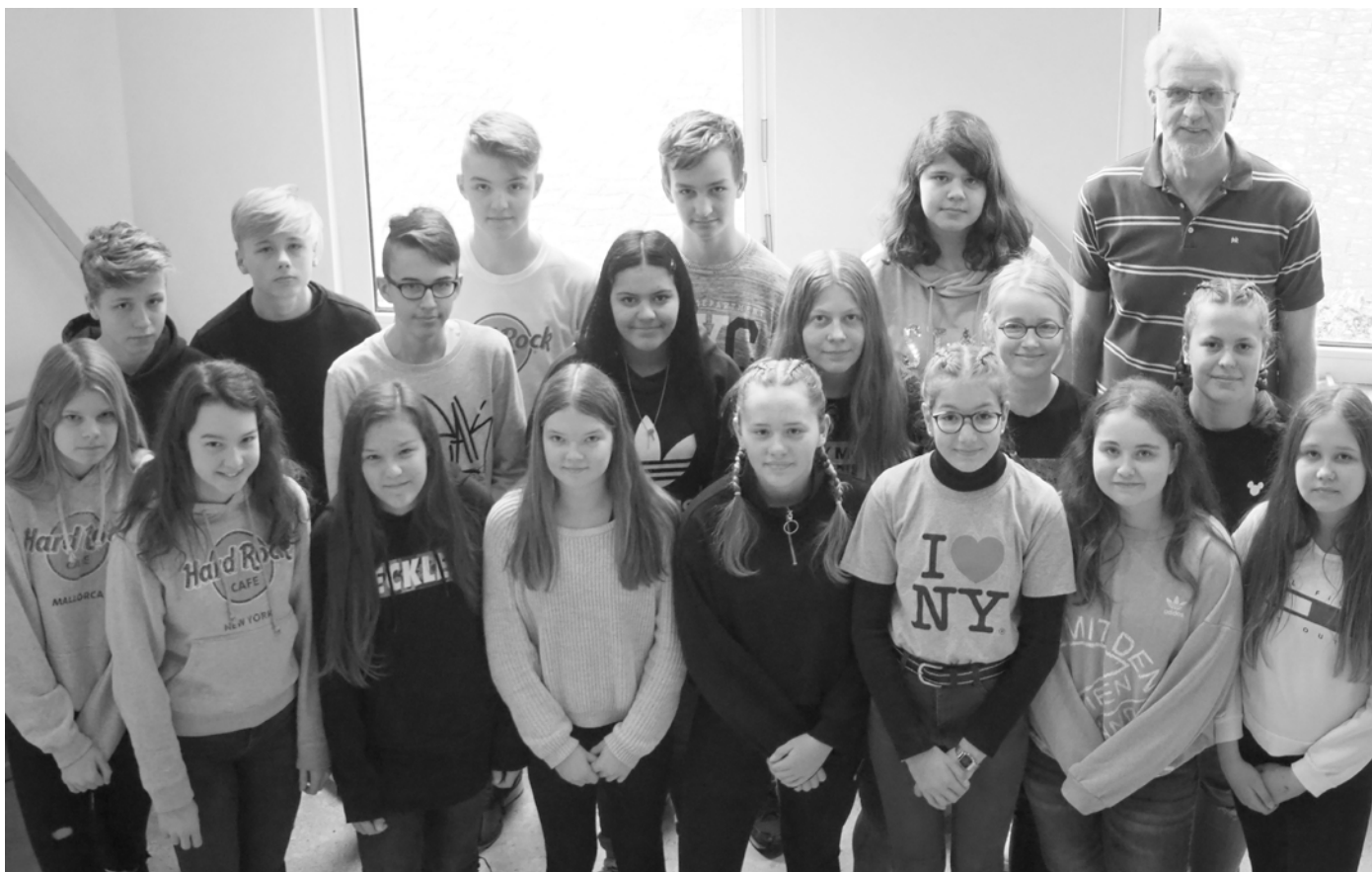
Diese Jugendlichen aus dem Bezirk Mitte werden am 19. Mai in der St. Johannes-Kirche eingesegnet.

Am 19. Mai werden in der St. Johannes-Kirche folgende Jugendliche unter Gottes Segen gestellt: