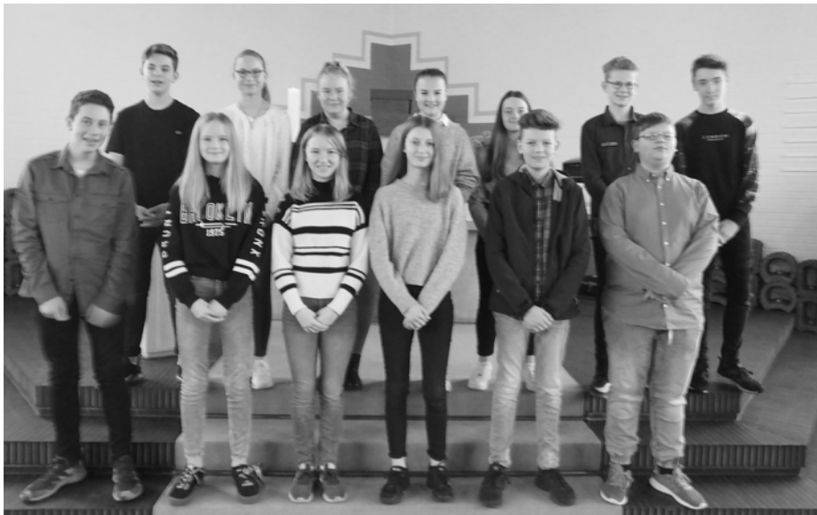
Diese Jugendlichen werden am 28. April in Tonnenheide konfirmiert.

Am 28. April werden die folgenden Jugendlichen in der Christuskirche in Tonnenheide von Pfarrer Rohrbeck eingesegnet (siehe Foto oben):