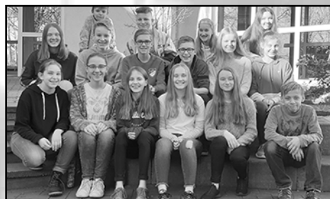
Konfirmationen 2019: Segen für 78 Jugendliche