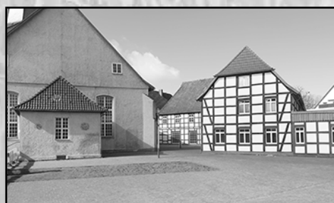
Sanierung des Kirchplatzes: Die Arbeiten gehen gut voran