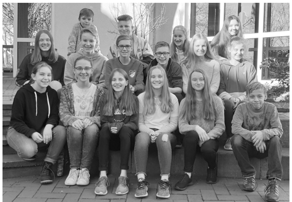
Die Konfirmandengruppe des Bezirks Rahden-West feiert ihre Konfirmation am 5. Mai in der St. Johannis-Kirche.