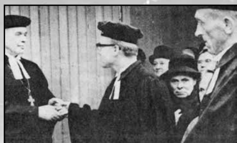
In Tonnenheide wird gefeiert: 50 Jahre Christuskirche