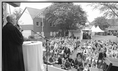
Kirche im Sommer: Predigtreihe und Open-Air