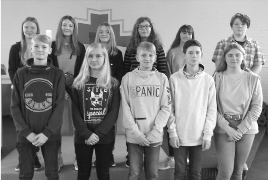
Ihre Konfirmation feiern diese Jugendlichen am 5. Mai in Wehe.

Von Pfarrer Rohrbeck werden am 5. Mai in der Auferstehungskirche in Wehe konfirmiert (siehe Foto oben):